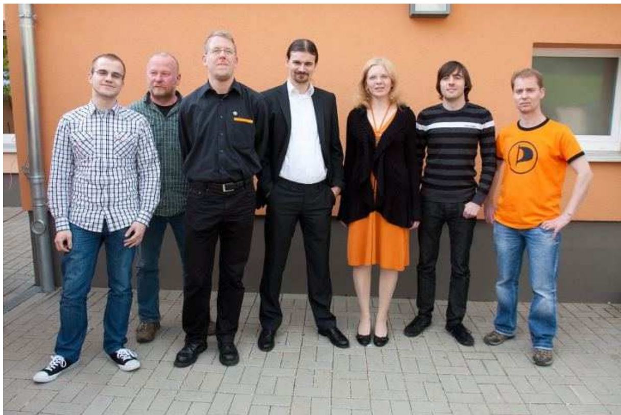
Foto | Der Vorstand der PIRATEN Thüringen