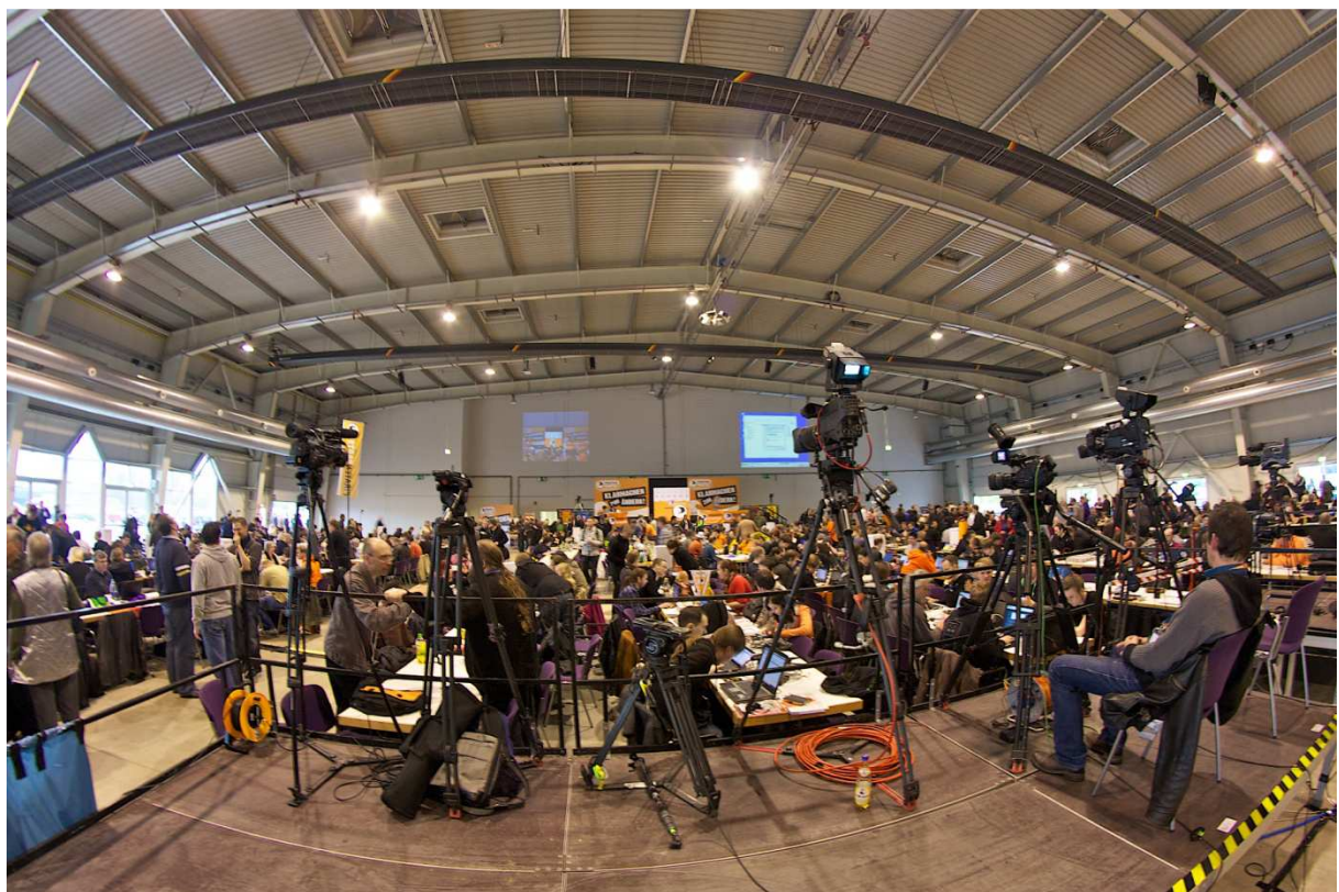
Foto | Pressetribüne auf dem Bundesparteitag 2012.1 in Neumünster (CC BY-NC Frank Coburger)