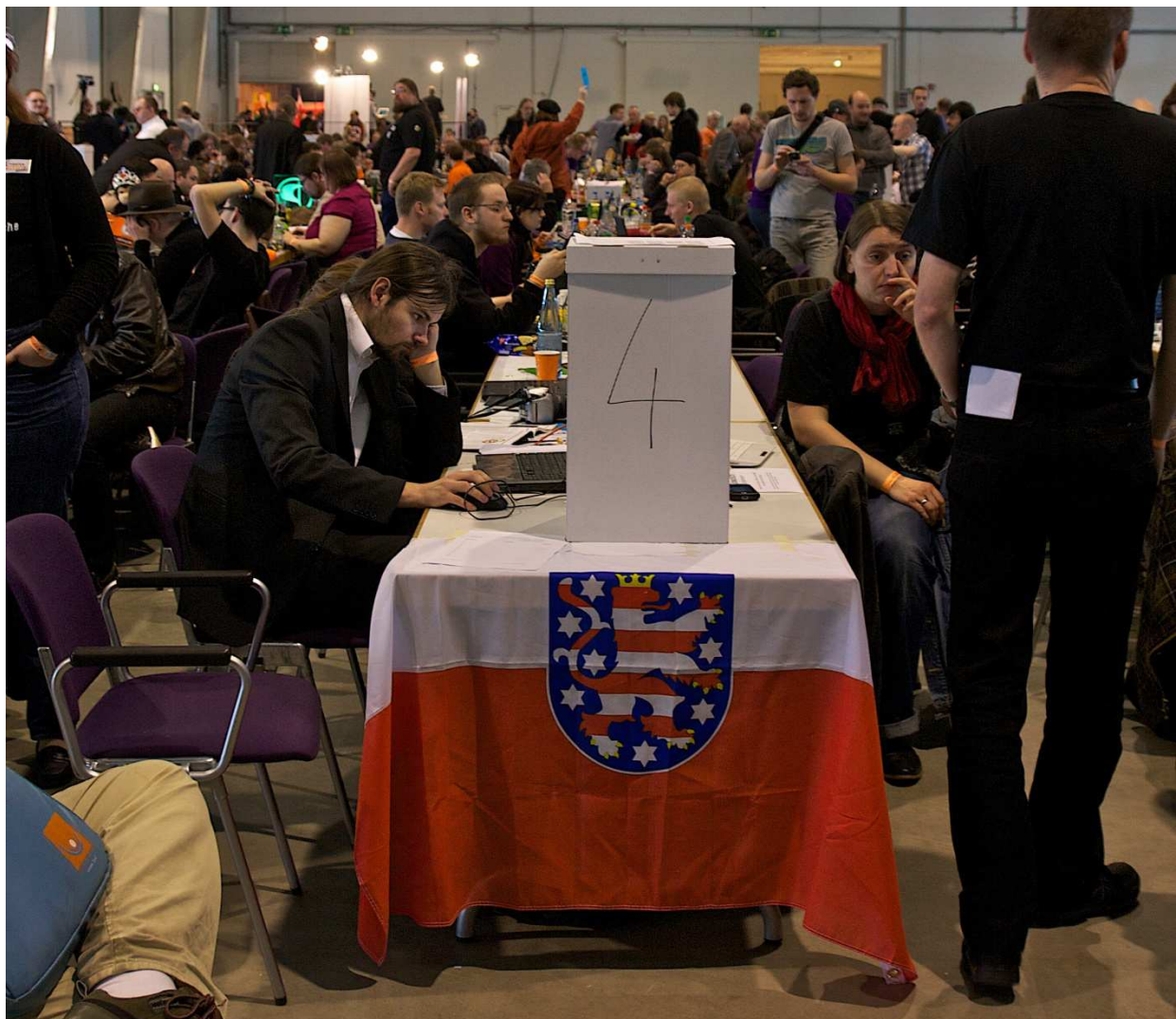
Foto | Thüringen-Tisch auf dem Bundesparteitag 2012.1 in Neumünster